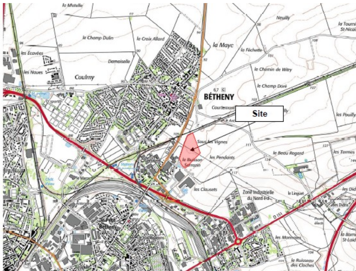
Figure 1 : Localisation du site d'étude dans la commune de Bétheny

Le site s'inscrit dans une zone classée 1AUXg du Plan Local d'Urbanisme (PLU) de la commune de Bétheny approuvé en décembre 2018. Les constructions des bâtiments de la plateforme ont déjà fait l'objet d'une évaluation par rapport aux documents d'urbanisme, lors de l'instruction du dossier d'enregistrement qui a fait l'objet de l'AP n°2019-E-100-IC.